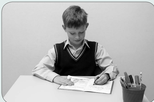
Prawidłowa pozycja dziecka leworęcznego podczas pisania