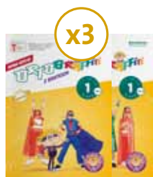
Ortografitti z Bratkiem kl. 1 3 ZESTAWY NA KLASĘ