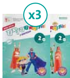
Ortografitti z Bratkiem kl. 2 3 ZESTAWY NA KLASĘ