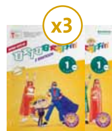
Ortografitti z Bratkiem kl. 1 3 ZESTAWY NA KLASĘ