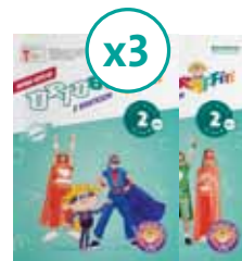
Ortografitti z Bratkiem kl. 2 3 ZESTAWY NA KLASĘ