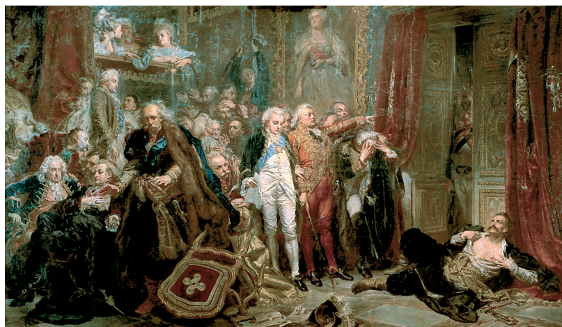
Jan Matejko, Rejtan (Upadek Polski)