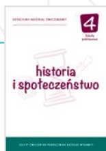
Dotacyjne materiały ćwiczeniowe