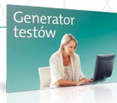
Twórz sprawdziany do lekcji